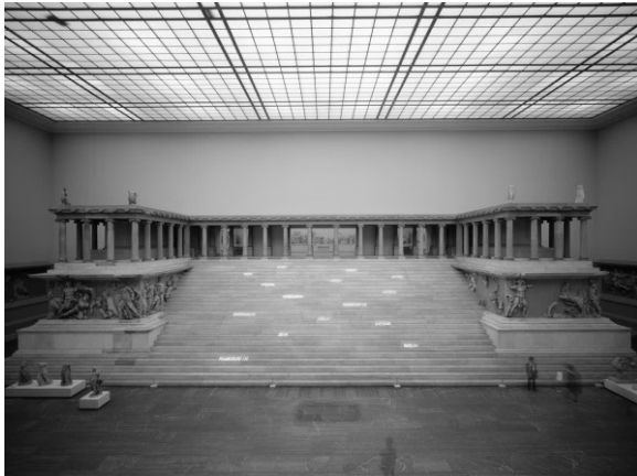
Figura Nº 1. The Aesthetics of Resistance , 1992-1993, Alfredo Jaar, Museo de Pérgamo, Berlín.

El primer caso, es la obra The way it is. An aesthetics of resistance (1992) en las escaleras del Altar del Museo de Pérgamo, en Berlín. Aquí, Jaar instaló con luces de neón los nombres de quince ciudades alemanas en donde habían sido atacados hogares de quienes pedían asilo político y de inmigrantes. En la pared opuesta, se aludía a los actos de violencia mediante fotos. También, se podía ver una foto de las botas típicas de los grupos de la derecha alemana. Además, se había realizado un plegable acompañando el proyecto, el que compilaba diferentes actos xenofóbicos ocurridos en Alemania en 1992. En este caso el artista desarrolla una obra crítica dentro de una institución artística, evidenciando un conflicto social. Podemos agregar a lo dicho por Mouffe que Jaar eligió para su instalación una de las salas más importante del museo, que es la que le da el nombre, e interviene en el Altar de Pérgamo, una reliquia arquitectónica del siglo II a.C., es decir, interviene el espacio arquitectónico de la Antigüedad.