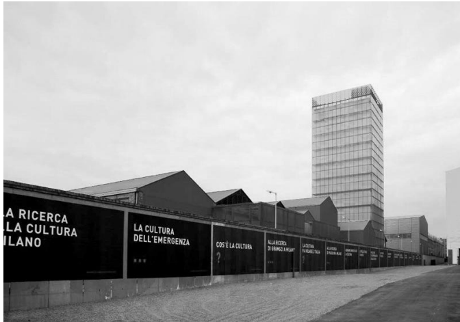
Figura N° 3. Questions, qüestions , 2008, Alfredo Jaar , Milán.

que toma relevancia es la intención del autor y la transmisión clara de un mensaje (Rancière, 2011, p. 39). Por otro lado, Mouffe exalta la forma de arte crítico que interpela a partir de generar un deseo de cambio y una reflexión que permita cuestionar el sentido común.