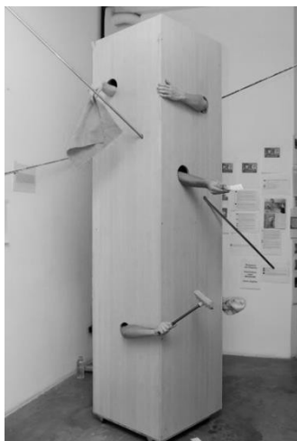
Figura Nº 2. Estado de spam, 2013, Diego Bianchi. ArteBA, Buenos Aires.

El segundo ejemplo analizado por Mouffé, también de Jaar, se denomina Questions, questions , una intervención pública realizada en 2008 en Milán, Italia. En esa ocasión, Jaar realizó carteles, ubicados en museos, lugares de arte, carteleras publicitarias y transportes públicos. Los textos, de tipografía sencilla, alternando los colores blanco, rojo y negro, planteaban preguntas acerca de la cultura y sociedad actual: “¿el arte es necesario?”, “¿el arte es política?”, “¿la cultura es crítica social?”, “¿el intelectual es inútil?”, entre otras. Según el artista, se pretendió realizar un cuestionamiento a la red mediática de Berlusconi (el entonces Primer Ministro) y sus autoritarias actitudes de banalización o silenciamiento de manifestaciones culturales y políticas no afines a sus intereses. De esta forma, su objetivo fue generar fisuras en el sistema, ocupando el espacio público con el fin de restaurar su significado (Mouffé, 2014, p. 101). Para Mouffé, Jaar enfatiza lo que ella denomina “estrategia de desarticulación” del sentido común existente y de fomento de una variedad de espacios públicos que contribuyen al desarrollo de una “contrahegemonía”. De esta manera,