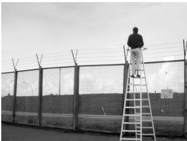
Figura Nº 5. Escritorio visionario sobre el Cerco de Spreehafen, 2008, Ala Plástica, Distrito de Hamburgo-Wilhelmsburg, Alemania.

En síntesis, estos ejemplos muestran la variedad de espacios en los que se puede intervenir, generando fisuras o desarrollando movimientos contrahegemónicos desde el arte.