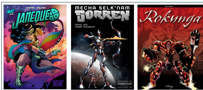
Figura 1: Historietas chilenas publicadas en la última década, representando respectivamente al pueblo mapuche, selk'nam y rapanu

Aunque el uso del término “pueblos originarios” para referirse al conjunto de pueblos que habitaban la actual región latinoamericana no está exento de debate por su idoneidad teórica y práctica (Mardones & Fernández, 2016), en este trabajo usaremos esa denominación para referirnos en particular a los pueblos o naciones que habitaban la región y tenían contactos entre ellos previa a la conquista europea.